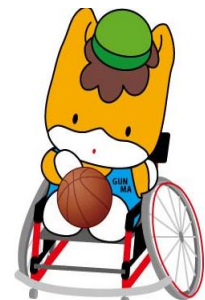
群馬県のマスコット 「ぐんまちゃん」