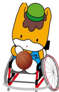
群馬県のマスコット 「ぐんまちゃん」